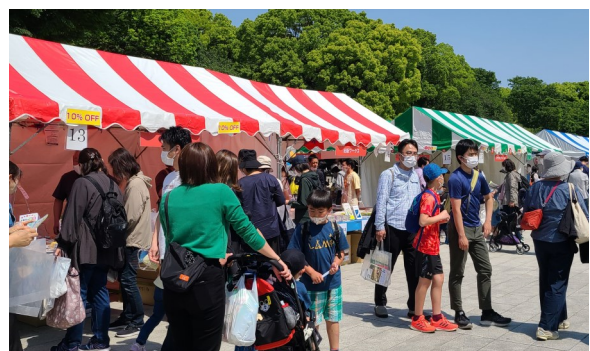
大勢の人でにぎわう上野恩賜公園(2022年)

本と出合う場所、本を通したさまざまな体験をしていただける場所として、絵本や児童書をはじめ、約4万冊の書籍を謝恩価格で販売します。皆様のご来場をお待ちしています！