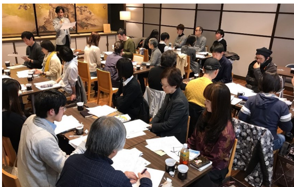
満席の人気プログラムに

3月2日（土）丸善 京都本店（京都市）にて、第6回京都フランス文学読書会を開催しました。今回はブルーストの『消え去ったアルベルチーナ』が課題図書。28名の参加者たちが作品について思い思いの意見を交換し合いました。今回で6回目を迎えた読書会は、参加者数も安定し、リピーターも多い人気文学イベントとなっています。